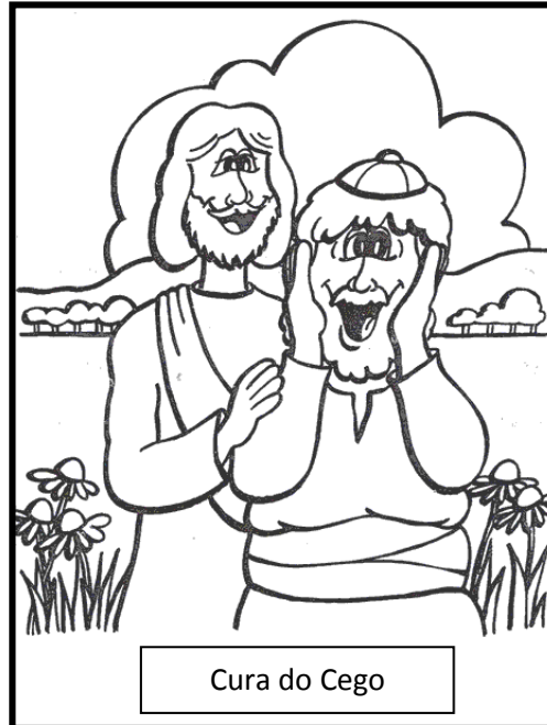
Cura do Cego